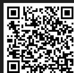
Formulario de registro